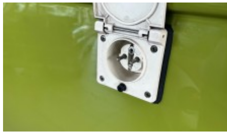
Einrichtung Westfalia - Typ Helsinki